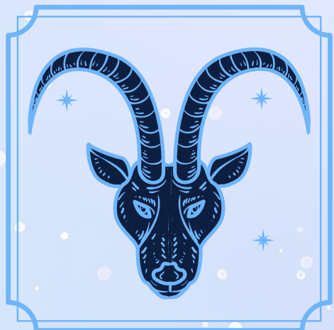
Capricornio (22 diciembre - 19 enero)

Cuando dicen “persigue lo que quieres”, no es literal. Porque perseguir transmite urgencia, y la urgencia ahuyenta. Así que ve tras lo que quieres, pero con sutileza. Reconecta con tu poder y no intentes forzar las cosas. Recuerda que se trata de fluir, no de forzar. Esta mentalidad te ayudará a perder el miedo a que te juzguen, a dejar de creer en falsas apariencias, y finalmente a sentir que estás en la cima del mundo.