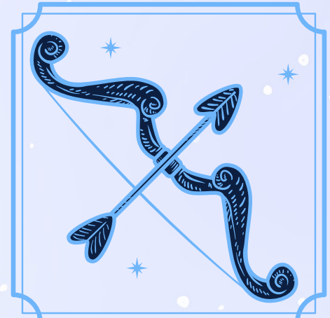
Sagitario (22 noviembre - 21 diciembre)

Suelta el miedo a fracasar y la necesidad de validación en lo profesional. Sin importar el camino que elijas, ya sea un trabajo de 9 a 5 o un emprendimiento, el éxito dependerá de que creas en ti, pongas esfuerzo y trabajes con dedicación. Es momento de organizar mejor tu tiempo y tus actividades. Además, será clave que actúes siempre desde la autenticidad. Cuando lo hagas, todo comenzará a alinearse a tu favor.