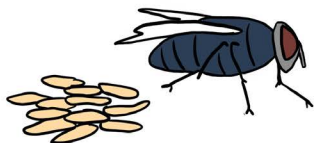
Mosca del nuevo mundo Cochliomyia hominivorax Sudamérica y El Caribe

Algunas especies de moscas depositan sus huevos en heridas superficiales de mamíferos. Es el comienzo de una invasión conocida como miasis