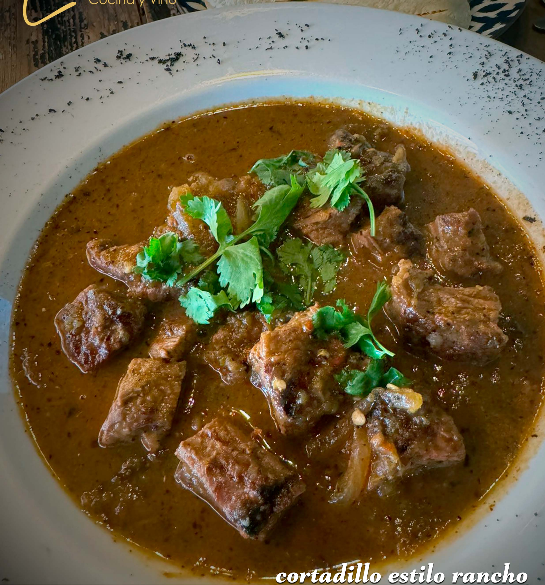
cortadillo estilo rancho