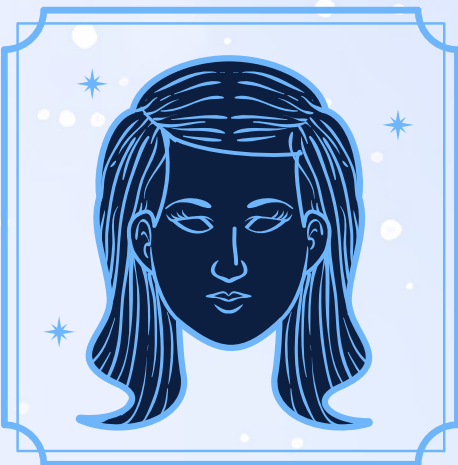
Virgo (23 agosto - 22 septiembre)

Siempre has soñado en grande, pero últimamente te has enfocado más en las limitaciones que impone el mundo. Es momento de recordar quién eres, recuperar tu brillo y reconectar con tu intuición. Presta especial atención a tus sueños, pues estarás recibiendo mensajes e ideas importantes a través de ellos. Una etapa de nuevos comienzos se acerca, y no te preocupes, lograrás avanzar incluso si aún cargas equipaje extra.