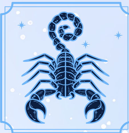
Escorpio (23 octubre - 21 noviembre)

No te cierres a algo futuro solo porque en el pasado te lastimaron. El pasado está para aprender, no para encerrarte. Simplemente de ahora en adelante elige con cuidado a quién le das tu tiempo, energía y amor. Pronto será momento de tomar acción y buscar llegar a tus metas, pero a paso lento y sin hacer cambios extremos; requerirás ser paciente. Al final del camino encontrarás ese brillo que habías perdido, y un par de sorpresas.