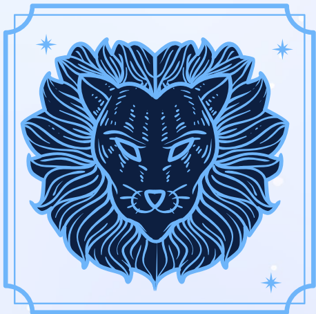
Leo (23 julio - 22 agosto)

Tu frustración te está empujando a rendirte en el amor y en tus finanzas porque sientes que nunca llegarás al punto donde quieres estar, que no está escrito para ti. Pero no hay nada externo bloqueándote, son tus propios pensamientos los que están frenando esas áreas de tu vida. Recuerda que lo que crees, creas; así que pon más atención e intención a lo que piensas diariamente, y también deja de aceptar menos de lo que mereces.