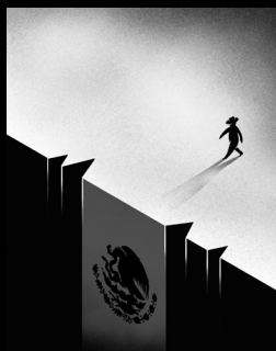
ILUSTRACIÓN: EDITH LEIJA