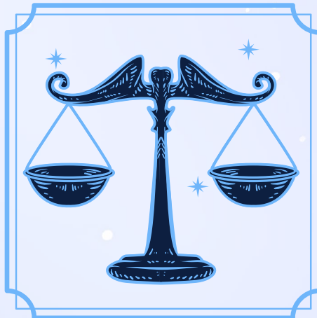
Libra (23 septiembre - 22 octubre)

Tu frustración te está empujando a rendirte en el amor y en tus finanzas porque sientes que nunca llegarás al punto donde quieres estar, que no está escrito para ti. Pero no hay nada externo bloqueándote, son tus propios pensamientos los que están frenando esas áreas de tu vida. Recuerda que lo que crees, creas; así que pon más atención e intención a lo que piensas diariamente, y también deja de aceptar menos de lo que mereces.